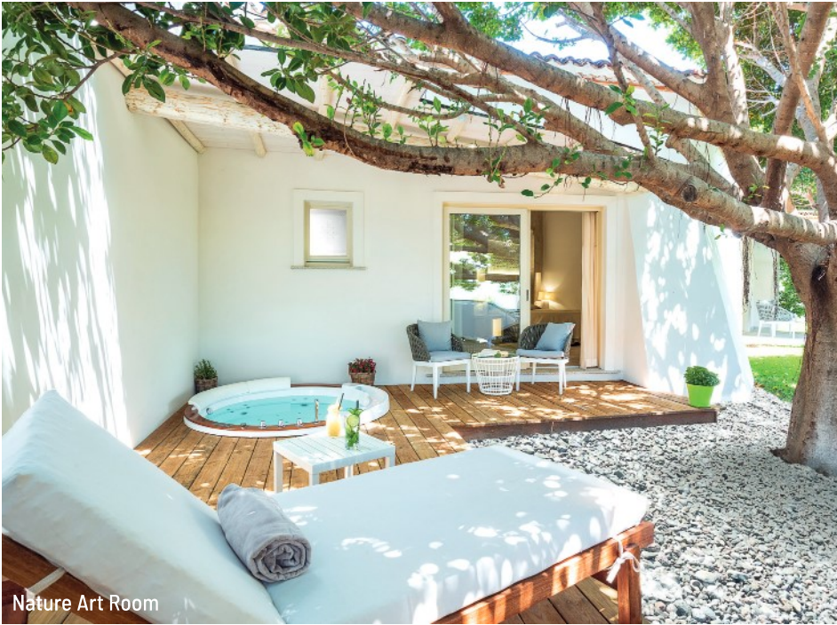
Nature Art Room